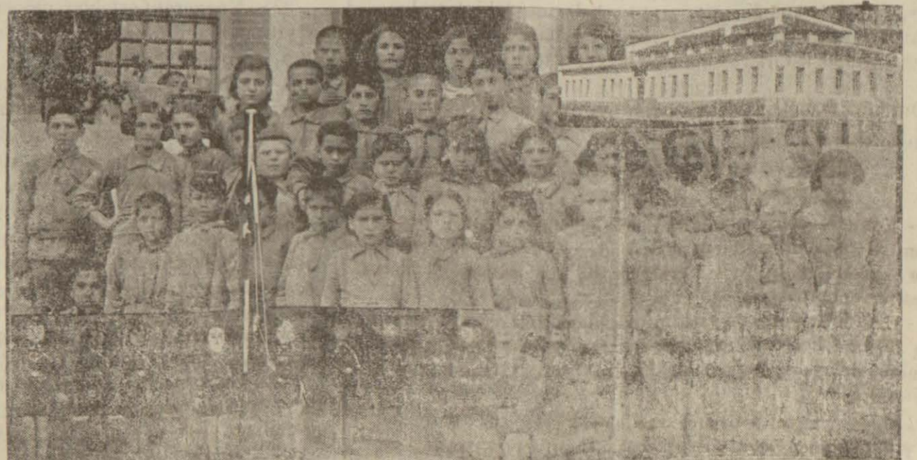
Cumhuriyet bayramına hazırlanan okul talebelerimizden bir grup

Şark muntakaları içinde bulunan muhtac zürraa tevzi edilecek arazi hakkındaki kararın hükümünün Ordu vilayeti nede teşmilî kararlatılmıştır.